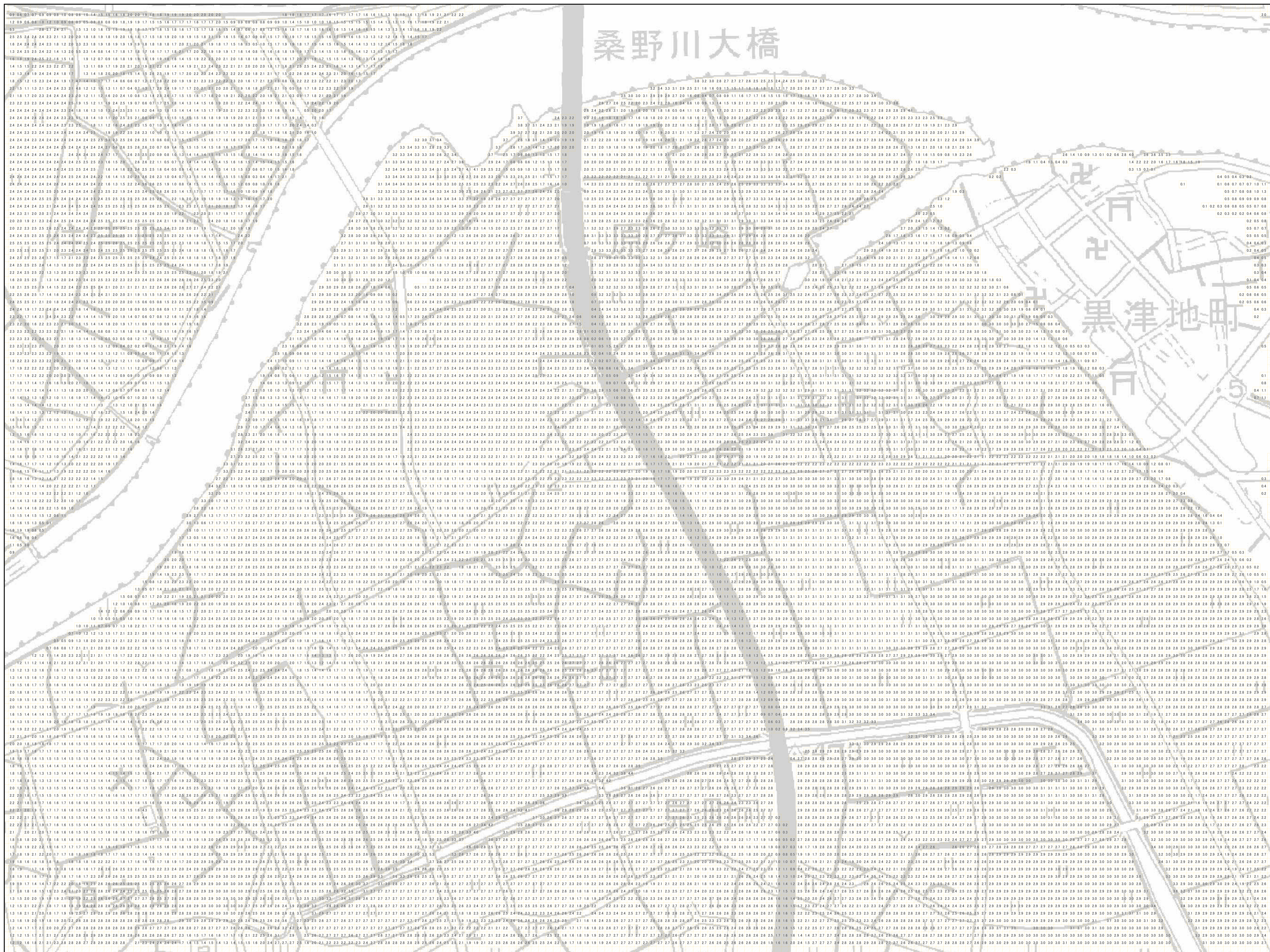
様式-2 津波災害警戒区域 区域図