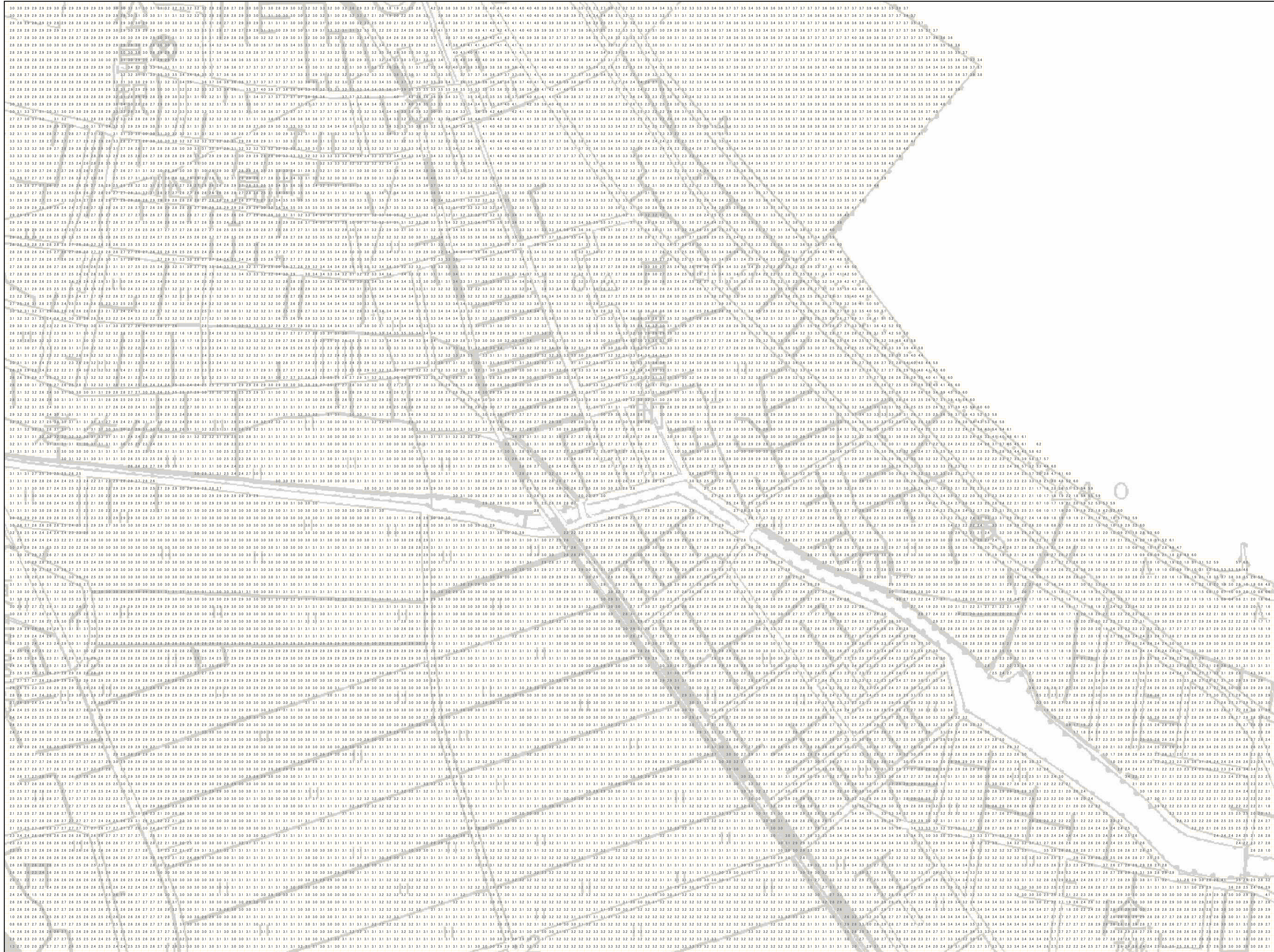
様式-2 津波災害警戒区域 区域図

【背景地図】 「背景地図」は、図面作成時の最新地形を基に作成しているため、道路や建物などが現況と異なっている場合があります。