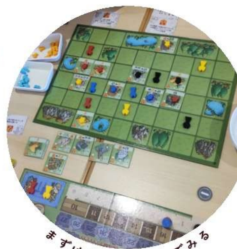
まずはじっくり遊んでみる