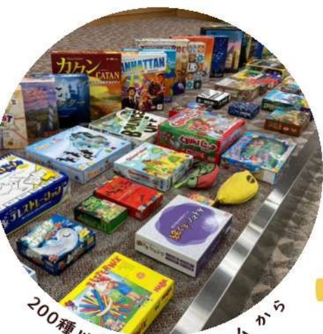
200種以上のボードゲームから