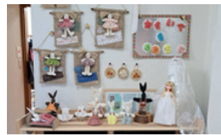
9 京人(けいと) ミニウエディングオーダー 手づくり小物販売