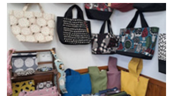
10 MIHO パテーション 布バッグ、布小物