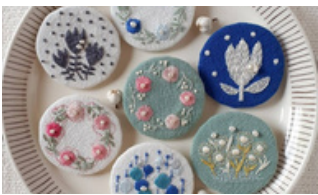
7 ニジイロ雑貨店 手刺繍アクセサリ コースター