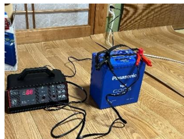
図4 バッテリーの接続

人工呼吸器の使用可能時間 医師の指示に従って使用可能時間 医師の指示に従って使用可能時間 患者の状況により使用可能時間 時間 + 時間 = 時間 搬送時の搬送可能時間 バイタル作動時間 時間 フレーカーを確認 フレーカーの使用しない場合は 内服電力 雲 に接続し、 ① 指示、電話連絡、住所 ② 呼吸していること ③ 人工呼吸器をつけた患者がいること ④ 必要な薬物 ( ) をはたきり扱え、適切な処置を講ずる。 患者の搬送する場合は連絡する 搬送時間 搬送方法 搬送者 雲