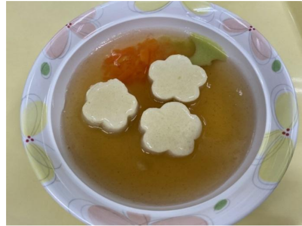
図6 ソフト食（嚥下食レベル3相当）

以上の4種類の食事から言語聴覚士や摂食嚥下認定看護師が嚥下機能を評価し、機能にあった食事を提供している。