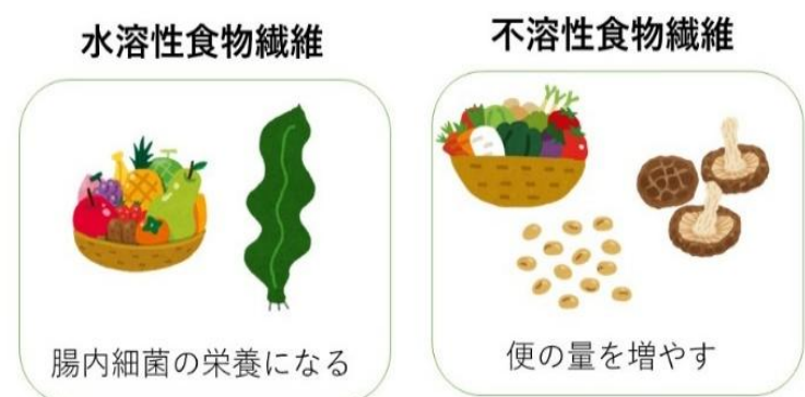
図3 便の材料になるものを摂取する