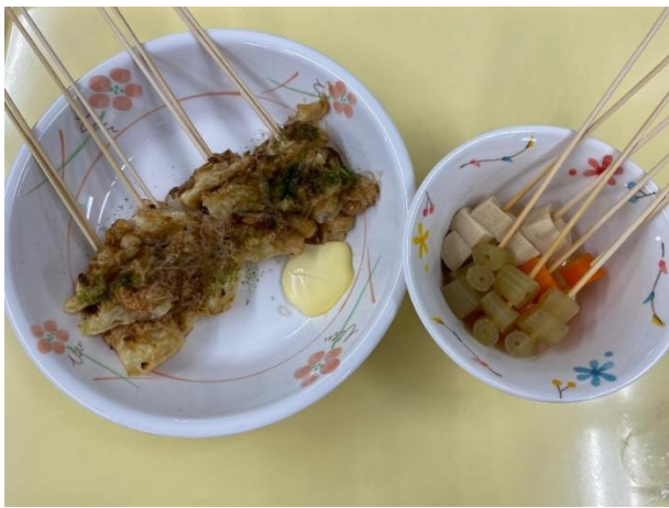
図4 串さし食（お好み焼き・高野豆腐の煮物）

パーキンソン症状をはじめ、神経難病疾患の方で、自分で食事が食べにくい方には、おにぎり食（三角・俵型）、串さし食（おかずを竹串にさす）（図4）、カット食（1cm・2cmスプーンやお箸でつかみやすいサイズにおかずを切る）（図5）などの個人対応も行っている。