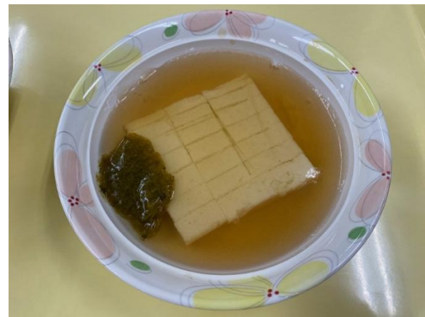
図7 ムース食（嚥下食レベル3）

3) 水分でむせる方には以下のとろみ茶の3種類の中から食事時の水分補給として食事にお茶を付けている。