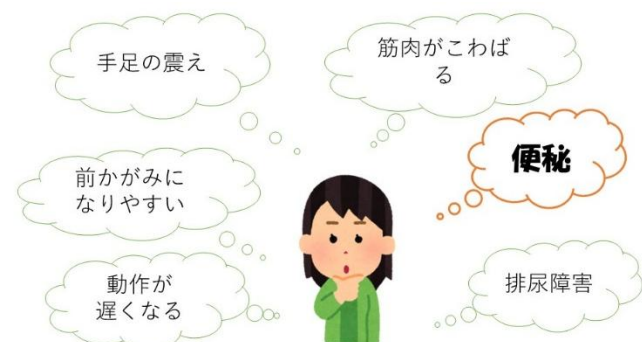
図1 パーキンソン病の症状

工夫など同じ病気を抱える患者同士の悩みも共有でき、退院後実践してみようと前向きな発言もみられている。