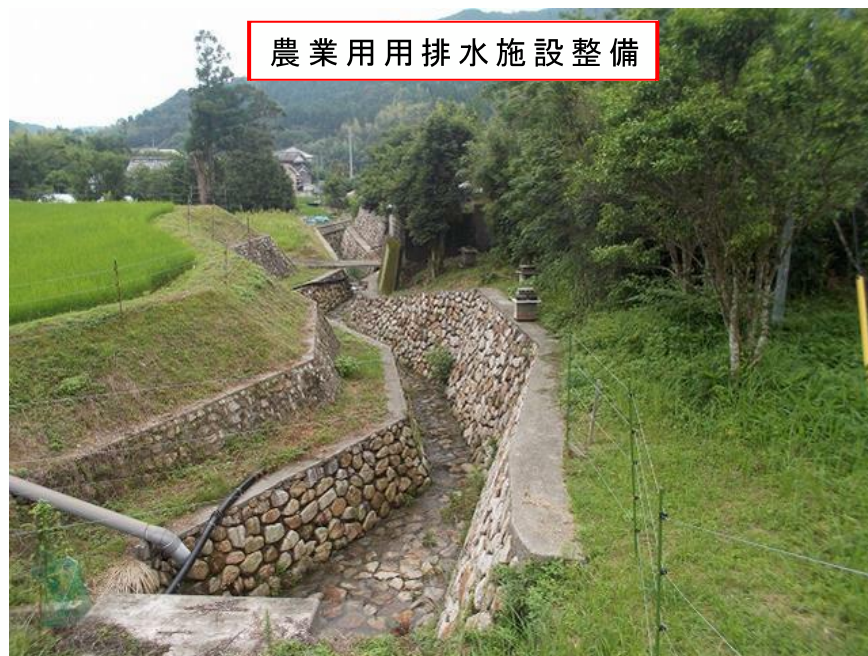
農業用排水施設整備