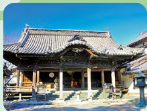
弘法大師が刻んだとされる 大日如来像に由来。