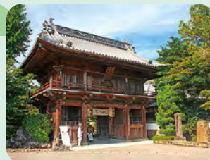
奈良時代に開かれた、四国 八十八ヶ所霊場巡りの起点。