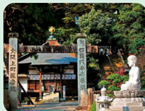
弘法大師のお手植えと伝わる 樹齢1,200年余の長命杉が有名。