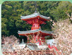
「黄金の井戸に顔が映れば 長生きできる」と言われる。