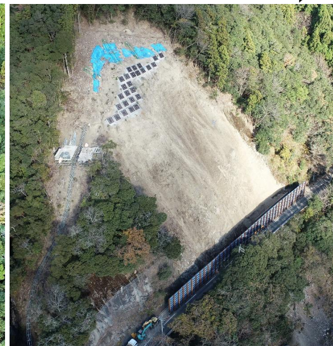
進捗状況写真 令和7年12月現在 ・アンカー工の一部が完成し、 吹付法枠工に着手しました。

※お問い合わせ先：徳島県南部総合県民局 那賀庁舎 工務担当（0884-62-0286）