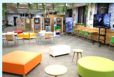
すだちくんテラス