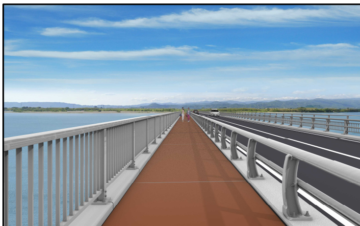
歩道完成イメージ