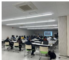
栽培講習会の様子