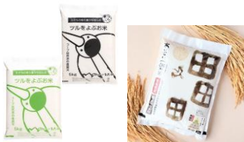
販売されている米の例 左：ツルをよぶお米（コープ自然派） 右：あいさい一楽米（JA東とくしま）