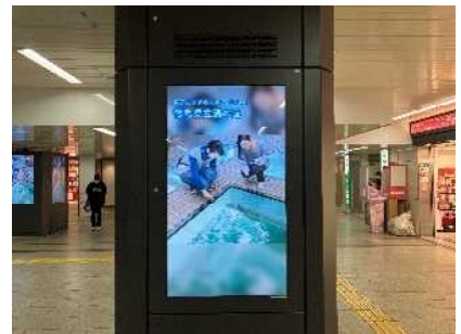
【関西圏での広報配信】

万博を好機として徳島の認知度を向上させるため、関西圏向けの広告配信やメディアタイアップ企画を実施し、万博期間中に徳島県内で開催される主要イベントや関連コンテンツの魅力を発信しました。