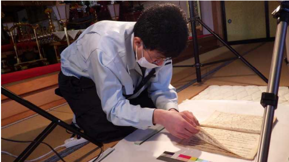
【札所(霊山寺)古文書調査】

「四国遍路」の世界遺産登録に向けては、札所や遍路道などの文化財を保全・保護する必要があり、文化財調査や測量調査等を実施するとともに、文化財指定に向けた取組を進めています。