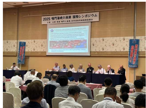
【鳴門の渦潮国際シンポジウム】

「鳴門の渦潮」の世界遺産登録に向けた取組を進めており、令和7年度は国際シンポジウムを開催するなど、渦潮の普遍的価値や魅力を発信し、登録に向けた機運醸成を図りました。