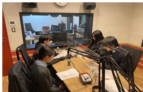
【放送による普及啓発】

「南海トラフ巨大地震」をはじめとする大規模災害が懸念される中、「防災」をテーマとしたラジオドラマのシナリオ・作文コンテストを開催しました。入賞作品のシナリオはラジオドラマ化、作文は音源化し、地元ラジオ局で放送を予定するなど、防災に関する普及啓発を推進しています。