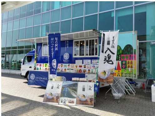
【「でり・ばりキッチン 阿波ふうど号」出動風景】

徳島県の農林水産物の魅力発信、消費拡大を図るため、県内外の市場や量販店などに2台のPR車両が出動し、県産品を使用した試食を配布し、PRを実施しています。