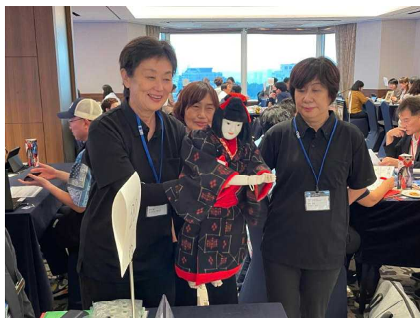
【阿波人形浄瑠璃の人間座を派遣】

「韓国観光・物産商談会」に阿波人形浄瑠璃の人形座を派遣し、五穀豊穡などを祈願するおめでたい演目である「三番叟」の公演を実施しました。世界に向けて、人形を通じた文化交流を図っています。