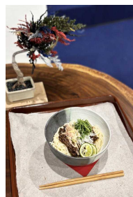
【徳島食材をアレンジしたカフェメニュー】