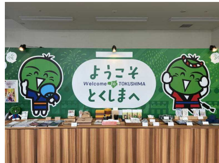
【国内プロモーションの様子】

ターゲット国・地域の小売店や飲食店への販路など、商流を有する県内の輸出事業者や地域商社などと連携した直接営業や、海外政府機関とのMOUを活かした商談会の開催などにより、県産品の海外への販路開拓や県内企業の海外展開を支援しています。