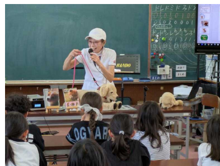
【児童への情操教育活動支援】

専門的な知識等を有する「アニマルケースワーカー」を、県内小・中学校へ派遣し、「命の授業」を実施しています。また動物愛護管理センターに収容された犬の中から心のケアを行う「セラピー犬」を育成し、病院等の施設を訪問しています。