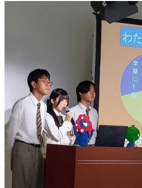
【若者によるプレゼンテーション】