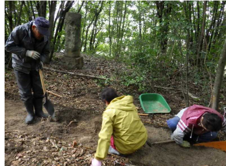
【寺院(十楽寺)発掘調査】