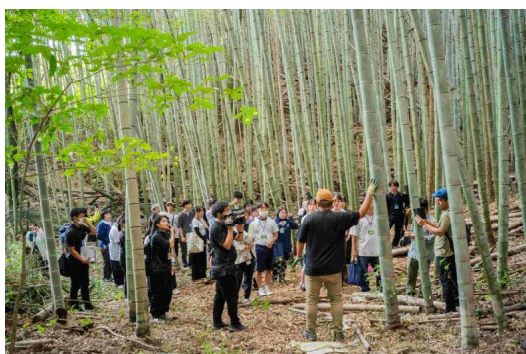
【フィールドワーク】

県内外の高校生が参加し、エシカル消費の専門家等を招いてパネルディスカッションや県内各地でのフィールドワーク、グループワークをしながらエシカル消費の視点から世界の課題解決について考え、発表する「とくしま高校生エシカルサミット2025」を2泊3日で開催しました。