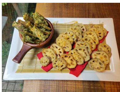
【レストランでのメニュー】