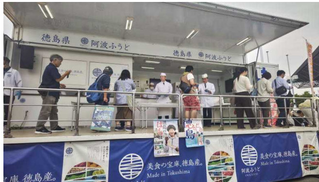
【「新鮮 なっ! とくしま」号出動風景】