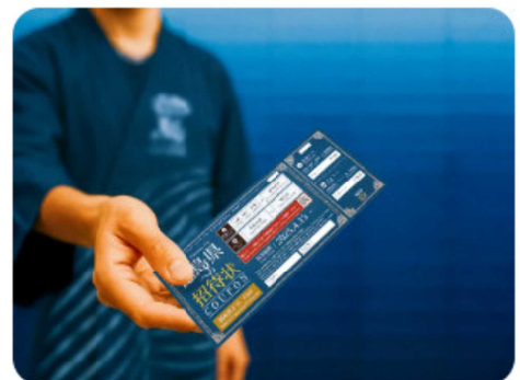
【徳島県への招待状クーポン】

万博をきっかけに徳島への誘客を促進するため、「徳島県ゾーン」において、関西圏から徳島行きのバス・フェリー料金が500円となる「徳島県への招待状」クーポンを配付し、国内外から多くの方に来県いただきました。