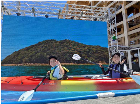
【ウォーターアクティビティ体験】

また、県内の若者によるアイデアや国際交流の成果発表会を開催し、未来に向かう徳島の姿を発信しました。