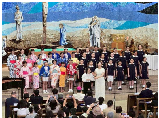
【少年少女合唱団の写真】

未来に誇れる文化の創造を図るため、徳島の少年少女合唱団が平和を祈るミサ曲や世界の歌、阿波踊りなどを韓国で披露しました。文化団体が自ら行う文化芸術事業の実施について補助金を交付し支援しています。