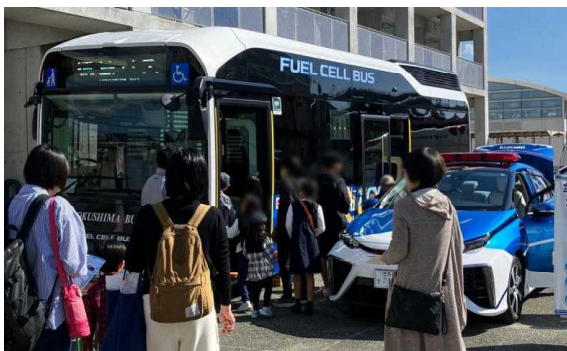
【燃料電池バスで水素エネルギーを体感・実感】

また、脱炭素型ライフスタイルへの早期転換に資する「太陽光発電設備・蓄電池・EV（電気自動車）」の導入を促進し、「脱炭素社会」実現に向けたクリーンエネルギーの活用を推進しています。