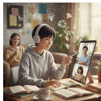
【バーチャルスクールカフェのイメージ画像】

生活困窮世帯の中学生に対し、オンラインによる学習機会の提供と、家庭環境などに配慮した相談対応を行っています。福祉事務所、町村社会福祉協議会、教育委員会、学校など、地域の方々の協力を得ながら、きめ細やかなサポートを目指しています。