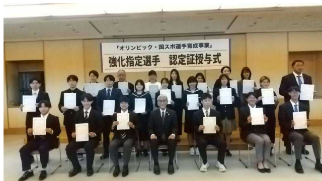
【強化指定演習 認定証授与式】

オリンピック選手の輩出や国民スポーツ大会での入賞数増加を目指し、ジュニア期からの選手育成や競技の普及、有力選手への強化等の支援を実施しています。