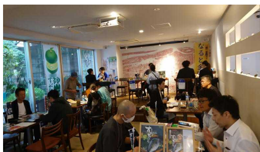
【阿波ふうど試食商談会の開催風景】

首都圏における情報発信・交流拠点「TurnTable（ターンテーブル）」では、レストランでのメニュー提供やマルシェでの物販を通して、県産品のテストマーケティングを実施している他、バイヤー向けの試食商談会を実施する等、県産食材の魅力発信や販路拡大に向けた取組を行っています。