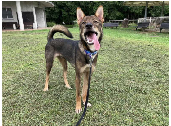
【全ての犬猫殺処分数ゼロ推進】

「全ての犬・猫の殺処分ゼロ」を実現するため、犬・猫の適正飼養の啓発や県内外民間団体との連携により、人馴れしていない野犬の馴致訓練を実施し、新しい飼い主への譲渡を促進しています。