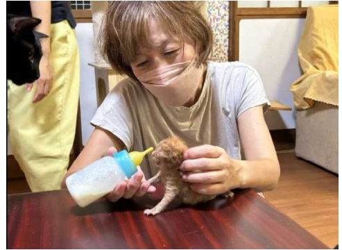
【殺処分削減のため、動物の適正飼養を推進】

専門的な知識・技術を有する「アニマルケースワーカー」を、不妊去勢手術に関する技術的支援を必要としている現場に派遣し、必要経費を支援しています。また動物愛護管理センターに収容された幼齢な犬猫について、譲渡可能となるまで哺育していただくミルクボランティアに対し、ミルクや哺乳瓶など必要物品を支給しています。