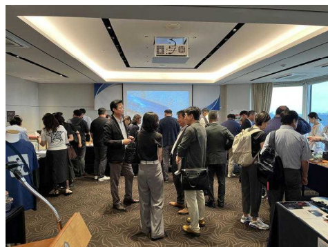
【韓国ミッションの商談会】

官民一体の地域商社のノウハウや知見を最大限活用し、県産品のブランディングによる売れる商品づくりを促進するとともに、観光・食・文化の一体的かつ効果的なプロモーションや魅力的な店舗づくりにより、県内外での販路拡大を図っています。