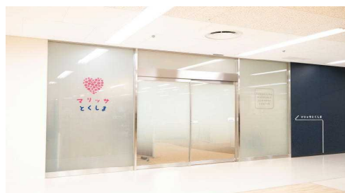
【マリッサとくしま】

「とくしまマリッジサポートセンター（マリッサとくしま）」は結婚を希望する独身男女に「お引合せ」や「イベント」「プチコン」等を通じて出会いの場を提供し、カップル成立後も交際フォローを行うなど、利用者に寄り添い、きめ細やかなサポートを行っています。