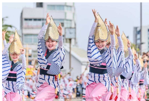
【はな・はる・フェスタ】

徳島への観光誘客と阿波おどりの振興を図るため、阿波おどりを核とした春の徳島を代表する一大イベント「はな・はる・フェスタ」の運営助成を行い、中心市街地のにぎわい創出につなげました。