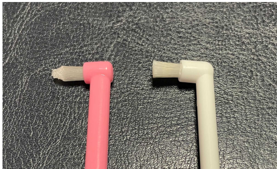
ポイント磨き用歯ブラシ