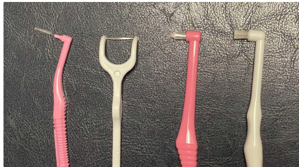
さまざまな補助的清掃用具

歯科医院で、今のご自身のお口の状態を確認し 歯科医師や歯科衛生士から、自分に合った口腔清掃用具での お手入れの方法を指導してもらいましょう！！