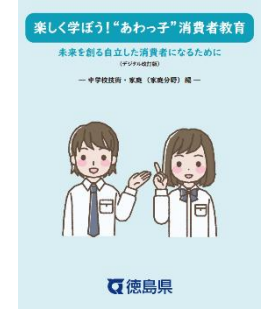
中学生向け教材 (デジタル改定版)