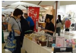
R6.8.4 藍住町ショッピングモール