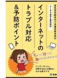
高齢者向けテキスト教材